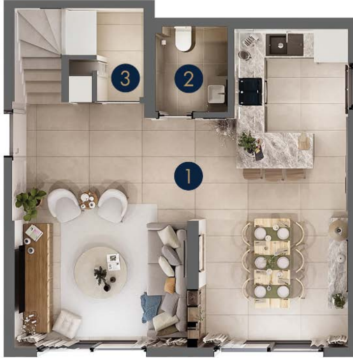
Tip 4/B • Zemin Kat