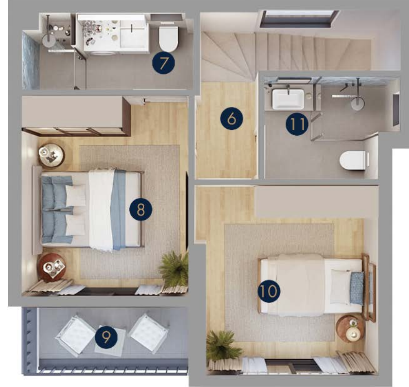
Tip 4 • Birinci Kat