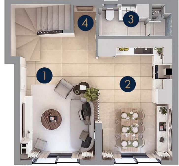
Tip 5/A • Zemin Kat

Zemin Kat Brüt: 49 m 2 Zemin Kat Net: 39 m 2