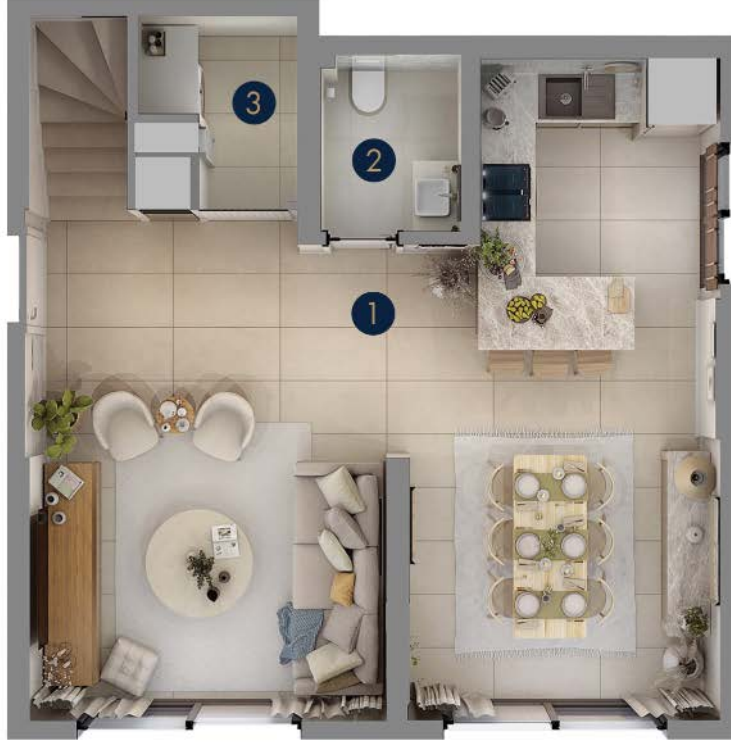
Tip1 · Zemin Kat