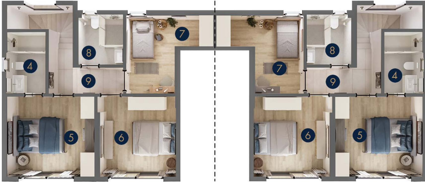
Tip 3/B • Birinci Kat