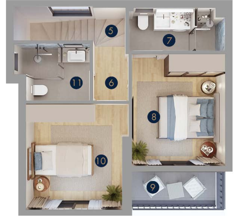
Tip 3 • Birinci Kat

Zemin Kat Brüt: 49 m 2 Zemin Kat Net: 39 m 2