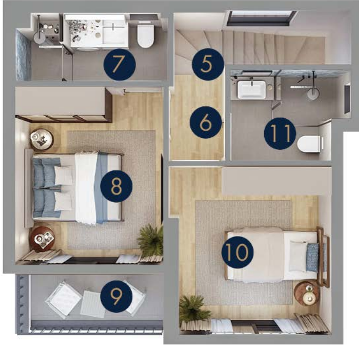
Tip 5/B - Birinci Kat