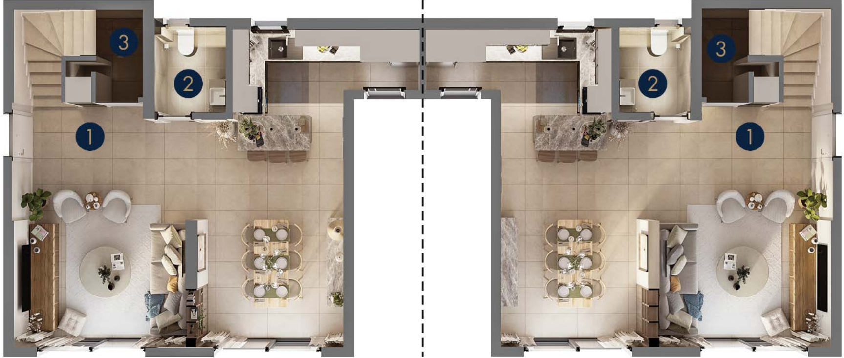
Tip 3/B • Zemin Kat