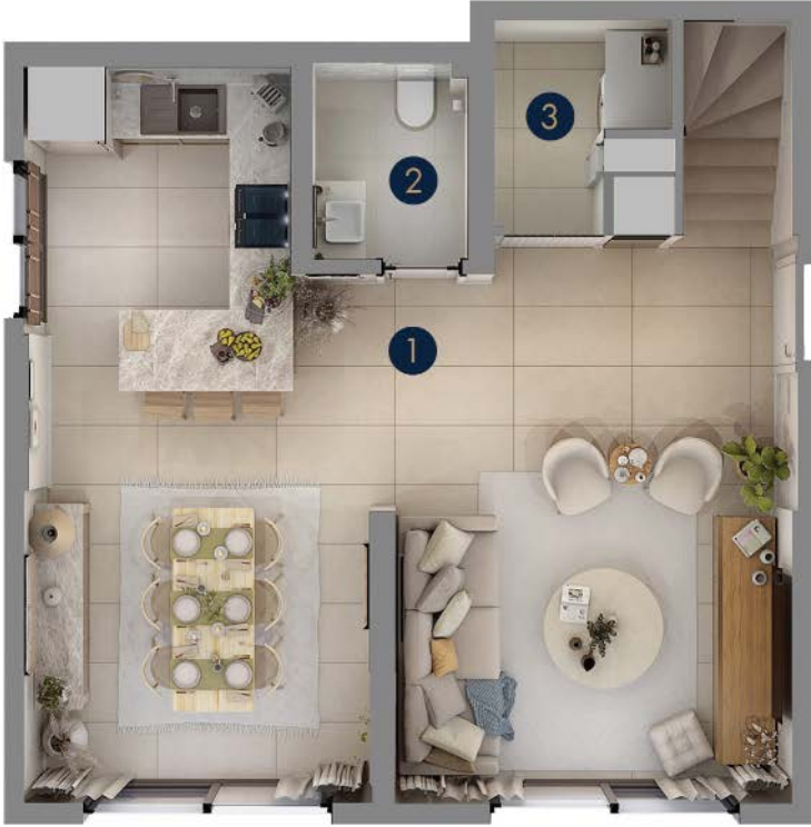
Tip 2 • Zemin Kat