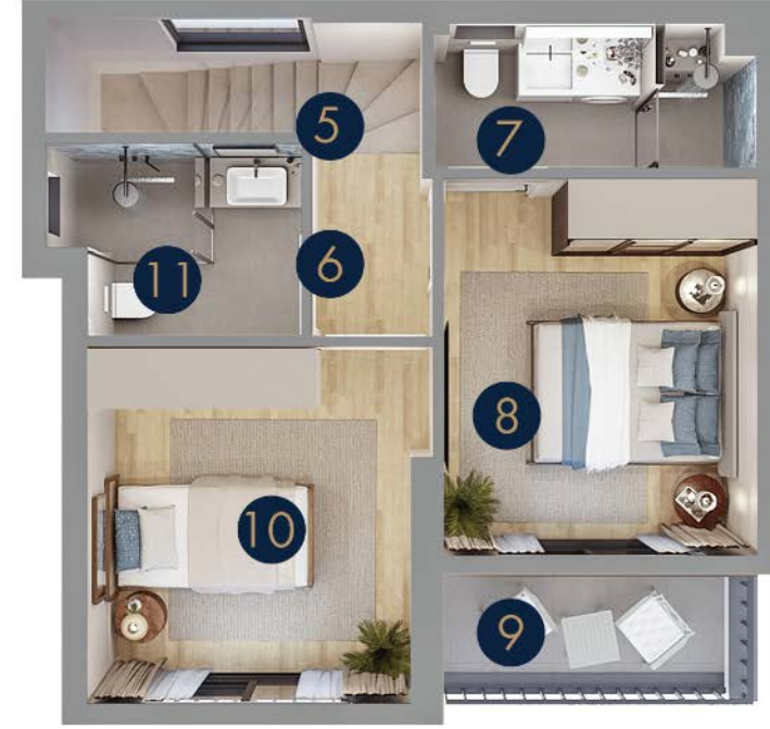
Tip 5/A - Birinci Kat

Birinci Kat Brüt: 49 m 2 Birinci Kat Net: 41.5 m 2 Toplam Net: 80.5 m 2 Toplam Brüt: 98 m 2