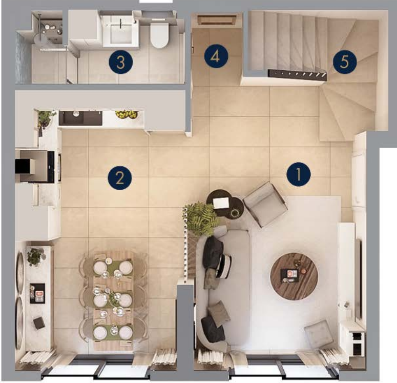
Tip 4 • Zemin Kat