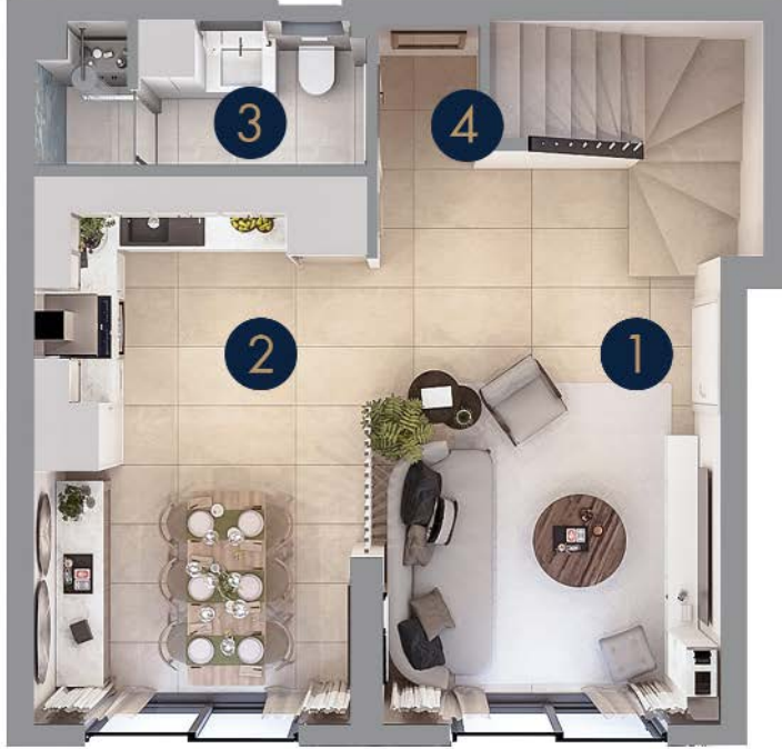
Tip 5/B • Zemin Kat