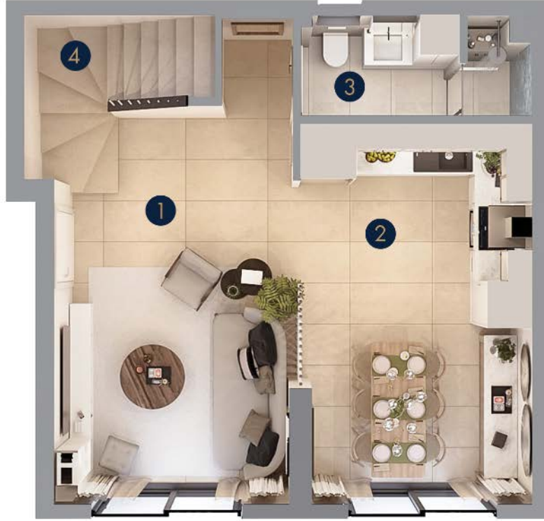
Tip 3 • Zemin Kat