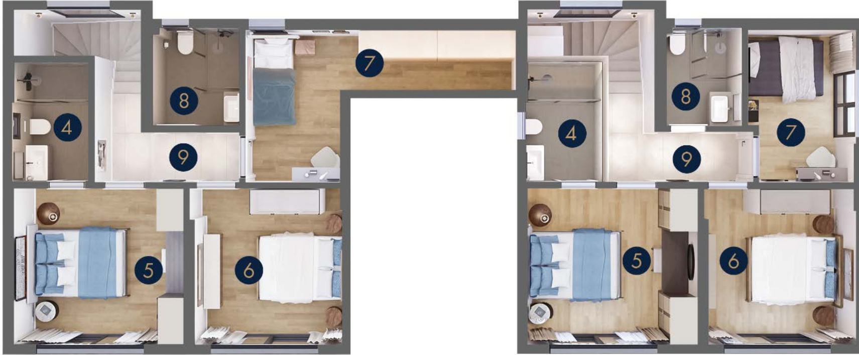
Tip 4/B • Birinci Kat