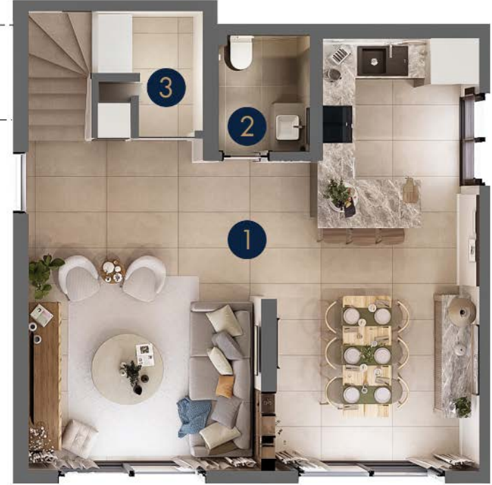
Tip 4/A • Zemin Kat

Zemin Kat Brüt: 59 m 2 Zemin Kat Net: 48.5 m 2