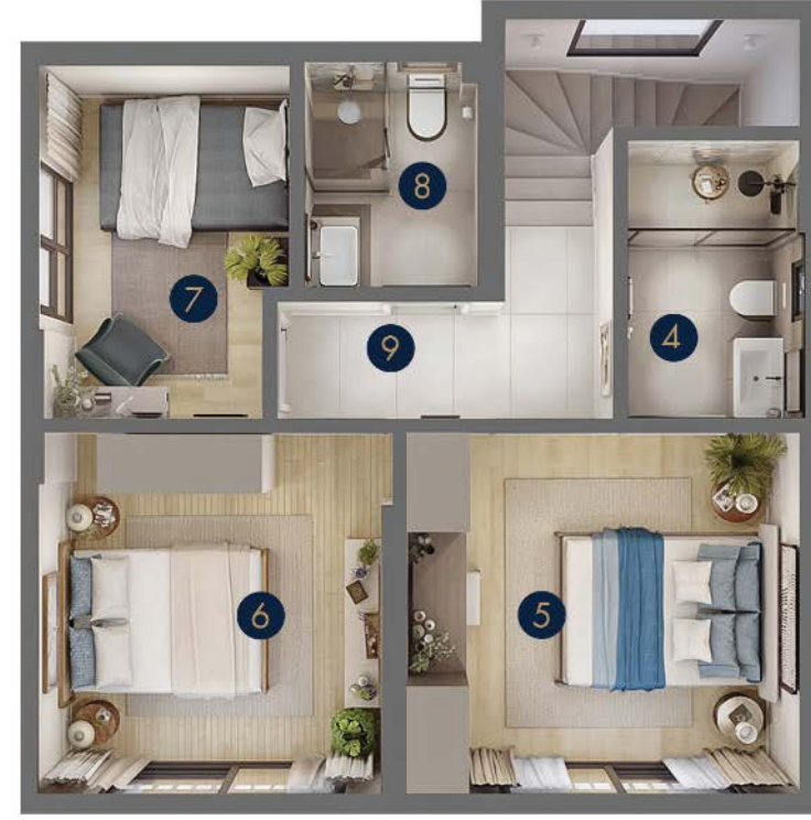
Tip 2 • Birinci Kat

Zemin Kat Brüt: 60 m 2 Zemin Kat Net: 50.5 m 2