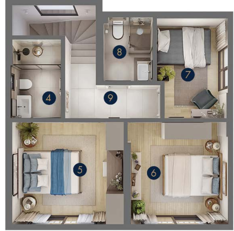
Tip1 · Birinci Kat

Zemin Kat Brüt: 60 m 2 Zemin Kat Net: 50.5 m 2